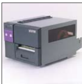
Impresión a alta velocidad en un ancho de 6"