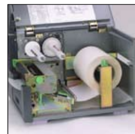
Dispensador y rebobinador de papel base