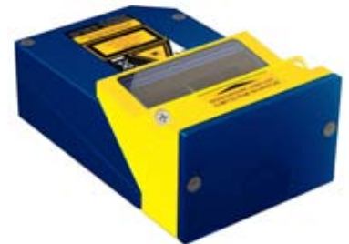
Espejo oscilante para amplia cobertura de lectura