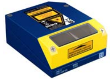
Solución de espejo para áreas de montaje limitadas/reducidas